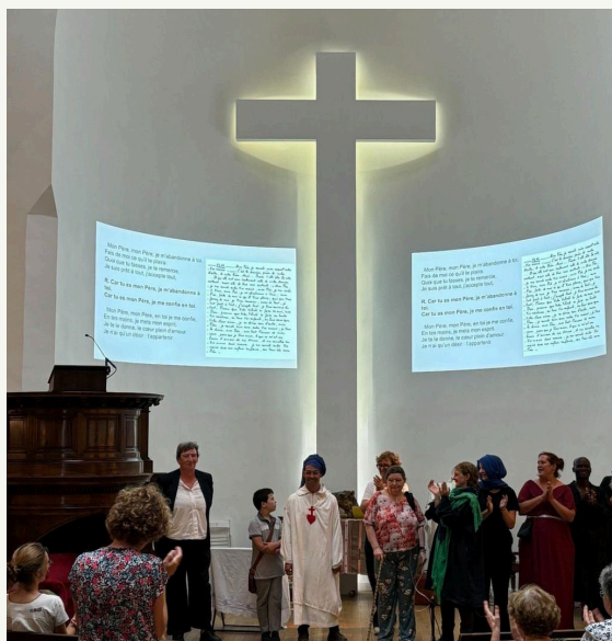
CHARLES DE FOUCAULD L'AMI UNIVERSEL REPRÉSENTATION AU TEMPLE GRIGNAN MARSEILLE, HOLYGAMES.

L'Esprit Saint continue de souffler pour emmener notre toute petite pièce et notre troupe de fragiles où bon Lui semble. Admirable.